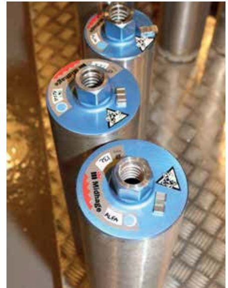
Nytt från Midhage är att de populära snabb-skärande segmenten Alfa numera även finns på kärnbörr.

Rent geografiskt ligger Midhages göteborgsanläggning bra i ett område nära centrum men samtidigt nära många andra företag med koppling till byggindustrin. Det här är ett hett område i en region som expanderar starkt. Det är också lätt att hitta dit då det ligger ett stenkast från Göta älv. För tillfället genomgår hela området en hel del ombyggnationer. Bland annat ska den gamla bron över till Hisingen ersättas med en ny och ytterligare en tunnel under Göta älv ska byggas. "När allt