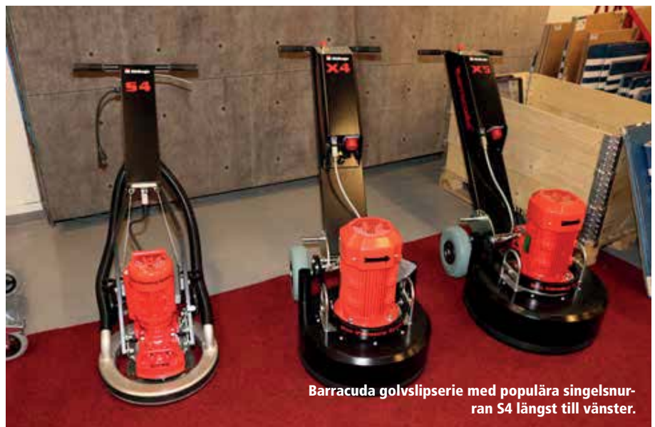
Barracuda golvslipliserie med populära singelsnurrar S4 längst till vänster.