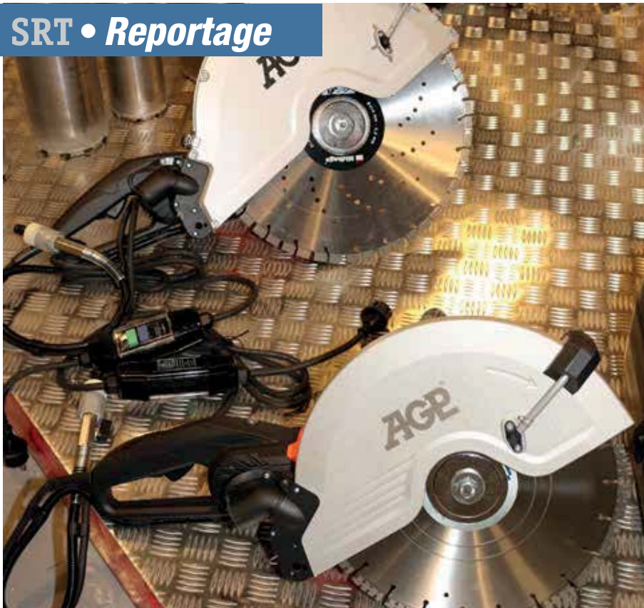
De nya eldrivna handkaparna från AGP har verkligen blivit en succé för Midhage. Nederst AGP C14 och AGP C16.