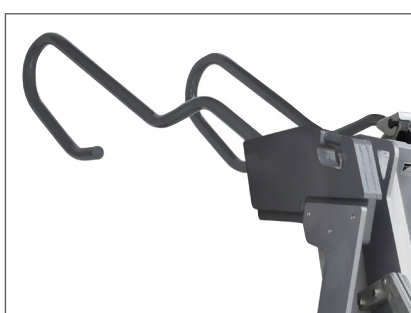
NYTT STÅLLBART HANDTAG