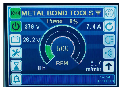
TYDLIG OCH ÖVERSKÅDLIG LCD-SKÄRM