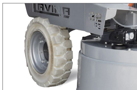
NYA FÖRBÄTTRADE BAKHJUL FÖR ENKEL OCH SMIDIG FÖRFLYTTNING