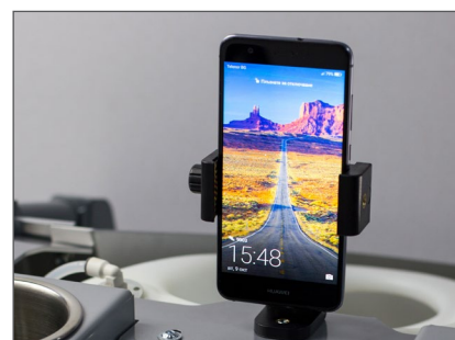
LADDSTATION MED DUBBLA USB