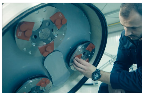
DAMMSÄKER PLANETARISK DRIFT