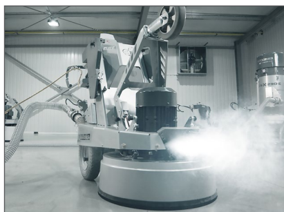
LEDBELYSNING FRAM OCH BAK